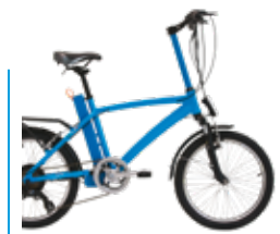
AZZURRO LIGHT BLUE